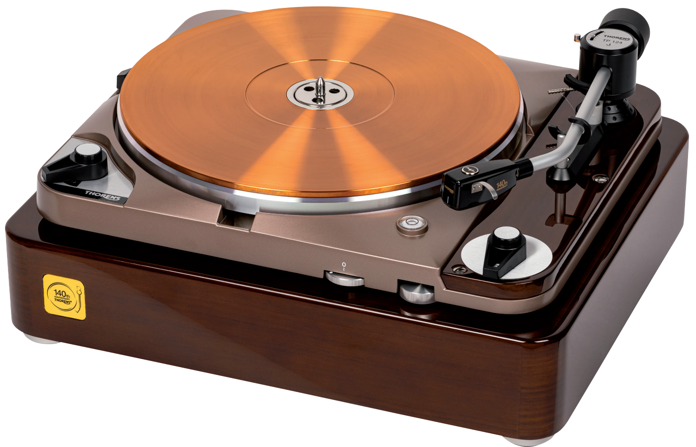
Thorens TD 124 DD 140th Anniversary